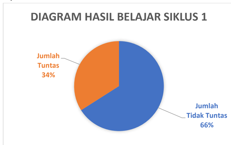
Gambar 2. Diagram Hasil Belajar Siklus 1

Berdasarkan hasil penelitian tahap siklus 1 pada tabel tersebut, dapat diketahui bahwa peserta didik dalam kategori tuntas sebanyak 8 peserta didik dengan persentase 34%. Sedangkan, kategori tidak tuntas berjumlah 16 peserta didik dengan persentase 66%. Skor tertinggi ialah 84 dan skor terendah yang diperoleh ialah 34. Diketahui rata – rata nilai pada siklus 1 ialah 53,9. Berikut visualisasi hasil belajar peserta didik pada siklus 1: