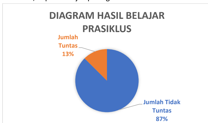
Gambar 1. Diagram Hasil Belajar Prasiklus

tertinggi yang diperoleh peserta didik adalah 78, sedangkan skor terendahnya ialah 22, dan rata – rata nilai yang diperoleh adalah 44,5. Untuk memvisualisasikan hasil belajar peserta didik, dapat merujuk pada grafik berikut: