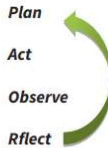
Gambar 1: Model PTK Stephen Kemmis dan MC Taggart

tahap kedua tindakan ( action ), tahap ketiga pengamatan ( observation ) dan tahap keempat refleksi ( reflection ).