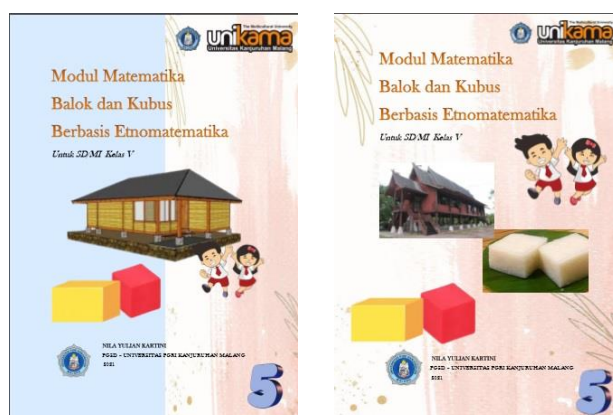
Gambar 2. Perubahan Tampilan Cover Depan Modul

maka dapat ditarik kesimpulan bahwa materi “Modul Matematika Balok dan kubus Berbasis Etnomatematika” masuk ke dalam kategori “Sangat Layak”. Berikut merupakan salah satu tampilan modul setelah divalidasi oleh ahli media.