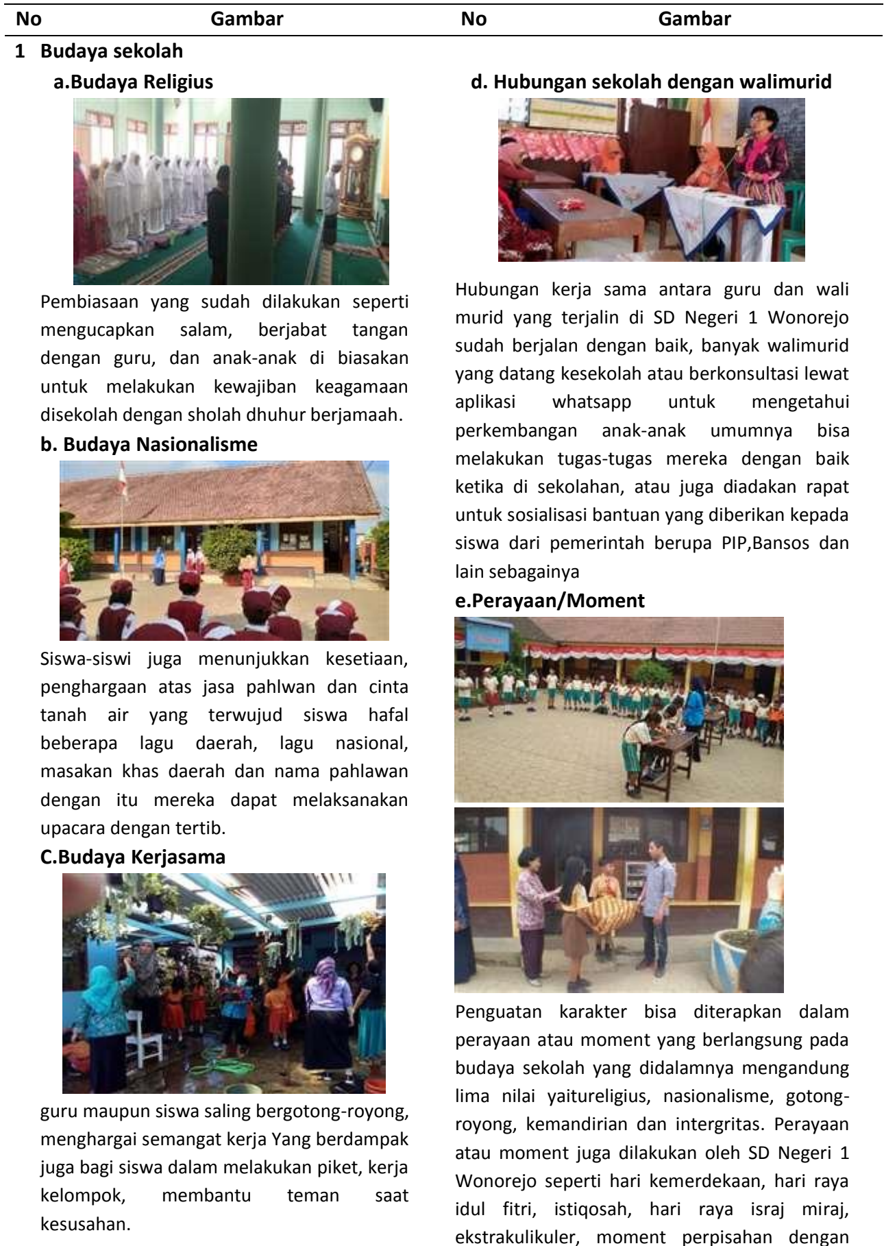
Tabel 2. Gambar penerapan social culture school dalam pembelajaran multiliterasi