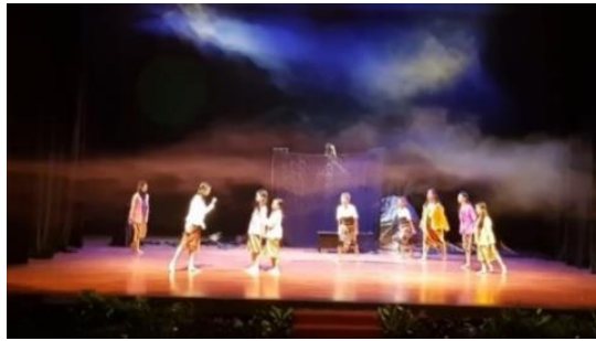
Gambar 6. Pentas PPST 2018 di gedung Cak Durasim Surabaya (D/ST/2018)

prestasi yang di torehkan dalam FLS2N dan PSP. Meskipun target yang sebenarnya adalah merah medali emas atau juara 1. Berikut di lampirkan beberapa kegiatan pada saat pelaksanaan program PPST tingkat Jawa Timur :