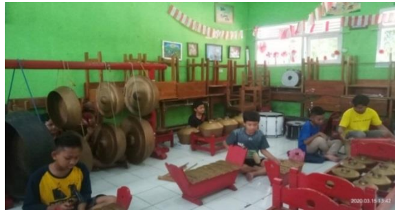
Gambar 2. Pelaksanaan Latihan seni Karawitan (D/K/15032020)

yang telah di berikan serta evaluasi pada saat latihan berlangsung. Sesuai dengan temuan penelitian dalam kegiatan evaluasi kegiatan Karawitan Jawa guru melaksanakan evaluasi proses. Berikut di lampirkan pelaksanaan seni karawitan di sekolah :