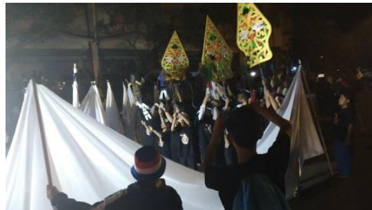
Gambar 9. 1 Wayang Wolak Walik di Nganjuk Jawa Timur (D/ST/2019)

Dari hasil penelitian menunjukkan bahwa (1) 75% pelaksanaan dan persiapan program berjalan dengan baik. (2) Persiapan pelaksanaan PPST dilakukan secara struktural dan telah di komunikasikan dengan baik. (3) Pelaksanaan Program telah menorehkan prestasi yakni Medali Perak selama 2 tahun berturut dan telah berhasil menarik perhatian masyarakat serta siswa untuk lebih mencintai kebudayaan. Hasil penelitian lain, yang dilakukan Karoso & Trihayanto (2017) menunjukkan hasil dalam menjamin terlaksananya program PPST di lembaga sekolah yang berkelanjutan dan berprestasi harus dikendalikan oleh seorang kepala sekolah. Kepala sekolah yang menerapkan konsep kepemimpinan transformasional dengan memegang teguh ajaran Ki Hajar Dewantara diharapkan dapat membuat pelaksanaan program PPST lebih hidup untuk kegiatan seni dan bisa mendapatkan prestasi di bidang seni.