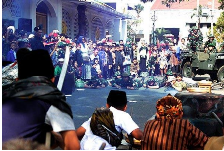
Gambar 8. Memperingati Hari Pahlawan dengan Teatrikal Hotel Yamato (D/ST/2019)

kegiatan yang di selenggarakan. Berikut di lampirkan kegiatan program PPST sebagai undangan dan kegiatan di sekolah :