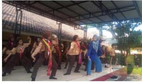
Gambar 4. Pengelompokan siswa perempuan (D/T/14022020)