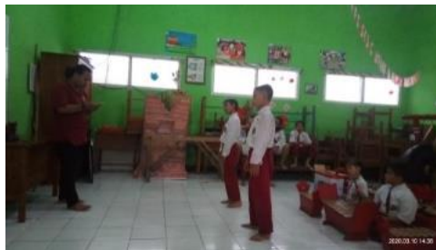
Gambar 5. Pelaksanaan latihan Seni Peran (D/T/14022020)

Dan tahap penutup, evaluasi di lakukan dengan cara tanya jawab serta menyampaikan ketercapaian target. Hal ini sejalan dengan pendapat (Ubaidah,2015) bahwa hasil dari evaluasi bermanfaat bagi pengambil keputusan untuk menentukan perlu adanya suatu program ekstrakurikuler dilanjutkan. Seni peran pasti memiliki target untuk latihan, tetapi tidak pernah melaksakan siswa untuk menghasilkan sebuah karya seperti pementasan. Target akan terbentuk sesuai dengan agenda yang sudah di susun pada program PPST salah satunya adalah lomba. Berikut dilampirkan pelaksanaan latihan Seni Peran di sekolah: