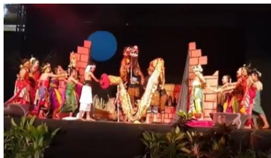
Gambar 7. Pentas PPST 2019 di Taman Krida Budaya Malang (D/ST/2019)

Mengenai target latihan juga di sampaikan oleh pelatih ekstrakurikuler seni tradisi. Untuk pelaksanaan persiapan agenda program PPST pada bidang seni tari belum ada latihan yang tidak sesuai dengan target. Hal ini sejalan dengan yang di sampaikan Karoso & Trihayanto (2017) dalam melaksanakan tugasnya untuk melaksanakan PPST, seorang guru yang telah ditunjuk sebagai PPST penasihat di lembaga sekolah akan membutuhkan dukungan, terutama dari para pemimpin. Peran kepala sekolah sebagai pemimpin lembaga sekolah akan menentukan keberhasilan program, serta prestasi sekolah termasuk kinerja guru. Kepala sekolah sebagai administrator di sekolah memegang peran yang sangat penting dalam mempengaruhi dan mengarahkan semua personil sekolah yang ada, untuk bekerja sama dalam mencapai tujuan organisasi sekolah.