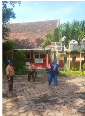
Gambar 5. Pengelompokan siswa laki-laki (D/T/14022020)

Pada dasarnya pembelajaran seni peran di Sekolah Dasar masih tentang dasar seni peran jadi belajar sambil bermain. Pelaksanaan pembelajaran seni Peran di SDN Purwantoro 2 Kota Malang bertumpu pada tiga tahapan utama yang bersifat universal yaitu, Tahap pendahuluan Sebelum latihan berlangsung guru pasti meminta siswa, untuk melakukan pemanasan, ada beberapa pemanasan yang biasa dilakukan oleh pelatih ekstrakurikuler seni peran agar tubuhnya tidak kaget atau merasa tegang. Salah satu jenis pemanasan tersebut merupakan olah vokal dan juga pemanasan tubuh seperti halnya yang di lakukan oleh seni Tari. (Ubaidah,2015) perencanaan kegiatan ekstrakurikuler dimaksudkan agar guru mempunyai pedoman yang jelas dalam melatih kegiatan ekstrakurikuler.